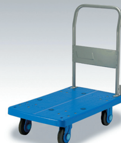
静音キャスター付プラスチック台車 PLA250DX